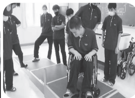
福祉科2年生「オープンスクール」準備風景