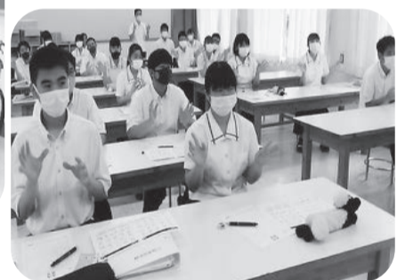
福祉科3年生 校内介護実習「手話講座」