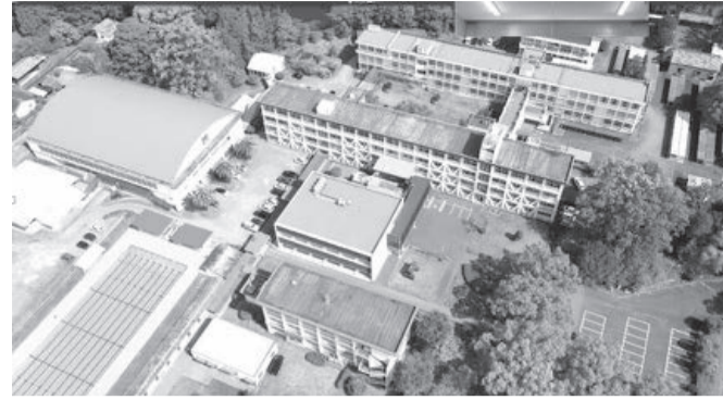
上空 150メートルまで撮影可能です。

生徒たちの豊かな創造力がドローン技術という新たな風の後押しされ、今後生み出されるであろう数多くの作品、活動がますます本校を輝かせてくれることでしょう。