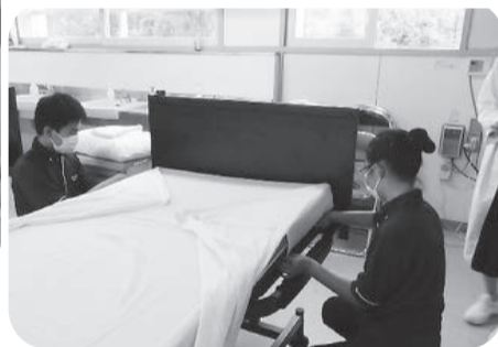
福祉科1年生「生活支援技術」授業風景